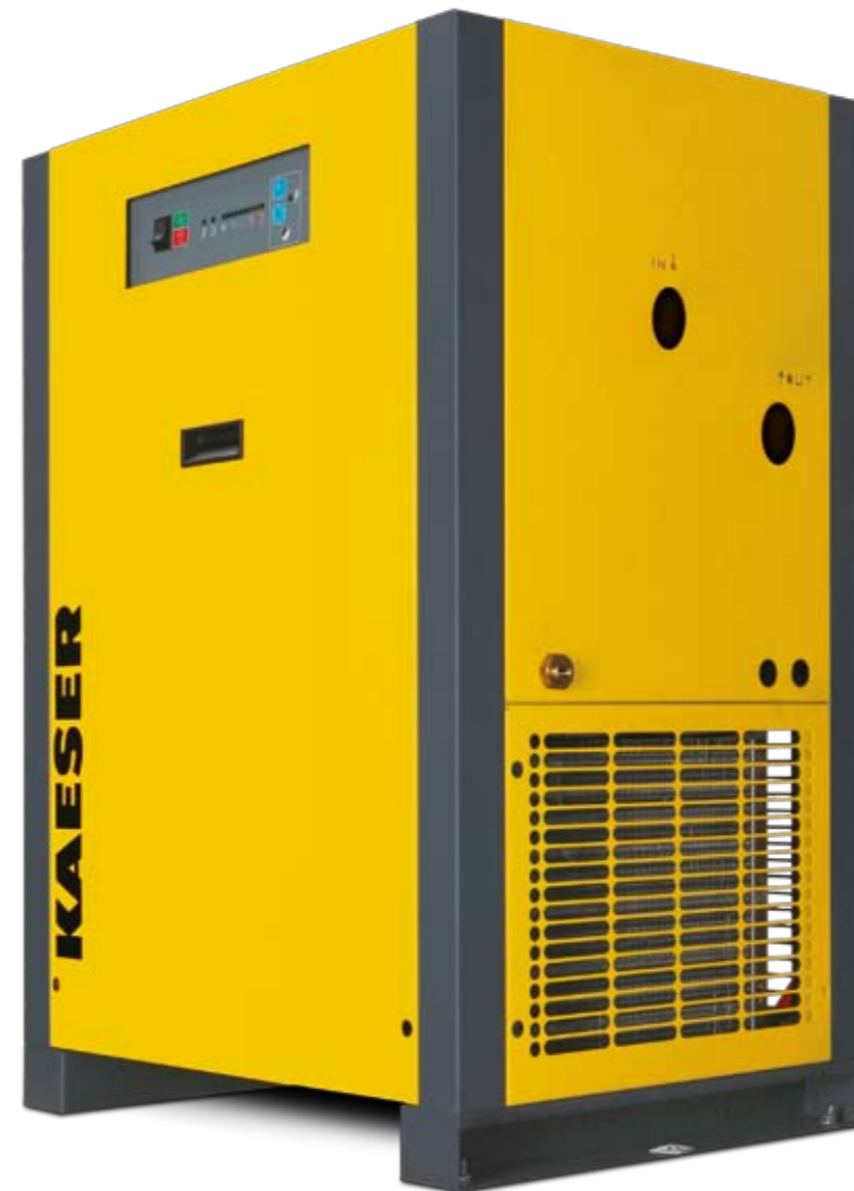
Grundausführung THP 40-50